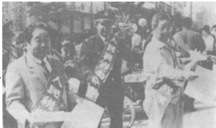
广饶县油区办成立多功能服务队

《中华人民共和国税收征收管理法》自1993年1月1日起施行。9月27日，市领导和有关部门负责人纷纷走上街头，宣传《税收征收管理法》。